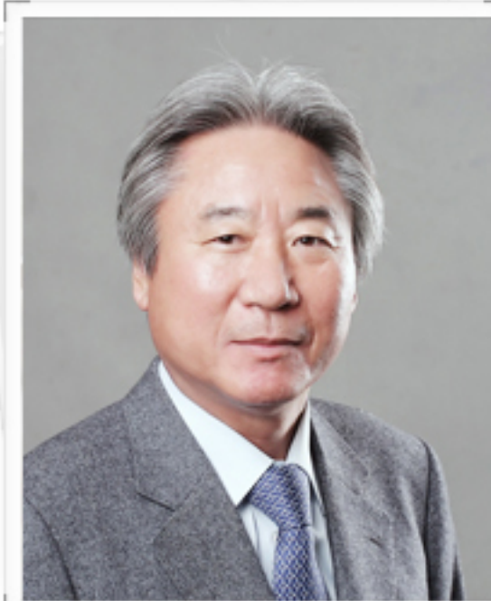
유찬건설 주식회사 대표이사 회장

유찬건설은 본사의 경영방침인 신뢰경영, 현장경영, 투명경영을 노력해 나갈 것입니다. 또한, 협력업체와의 상생경영과 첨단기술력을 바탕으로 편리함과 아름다움이 조화된 창조적인 공간을 건설하여 고객이 늘 100% 만족할 수 있도록 최선의 노력을 다할 것입니다.